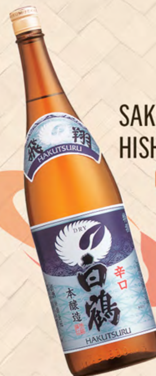
SAKE TOKUSEN HISHO DRY