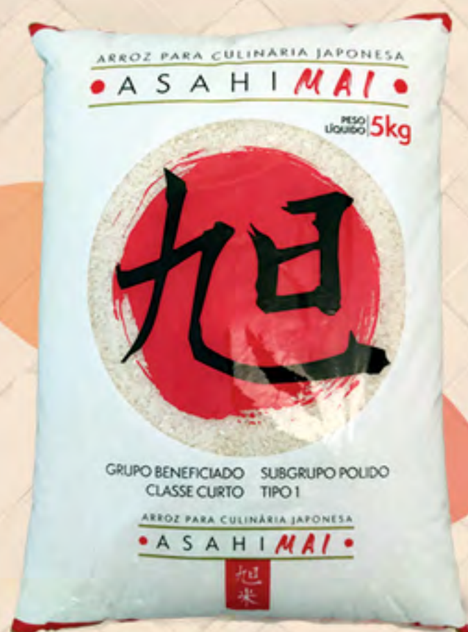
ARROZ ASAHI MAI CURTO