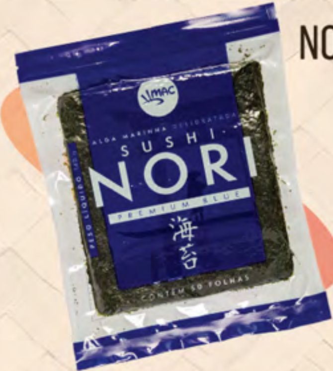
NORI BLUE 140 g