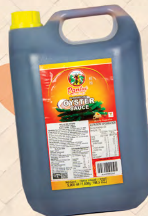
MOLHO DE OSTRA