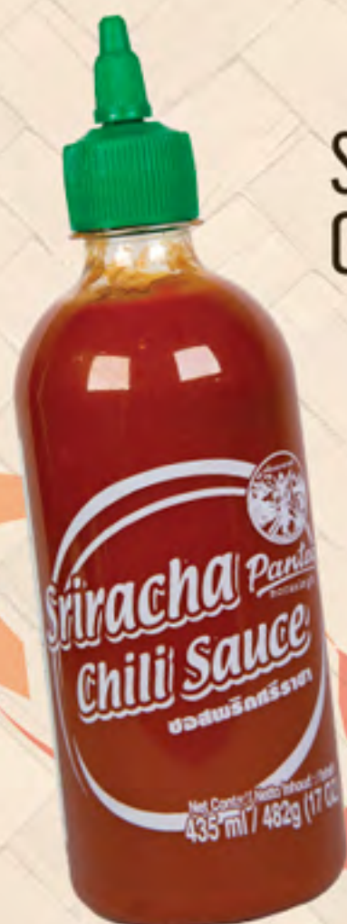
SRIRACHA CHILLI SAUCE