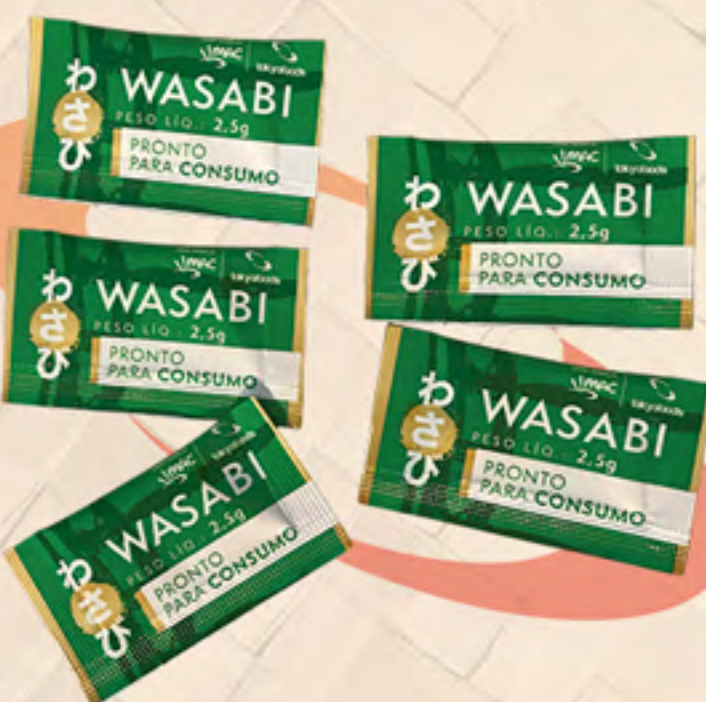
WASABI SACHÊ 2,5 g (cada)