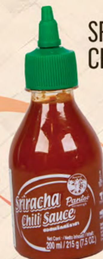
SRIRACHA CHILLI SAUCE