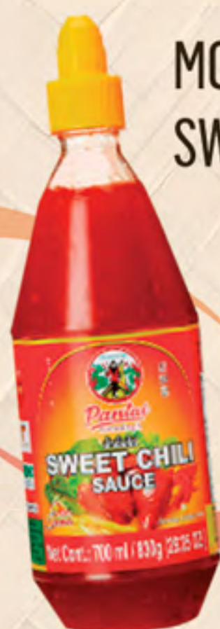
MOLHO SWEET CHILI