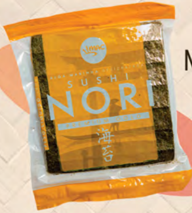
NORI GOLD 140 g