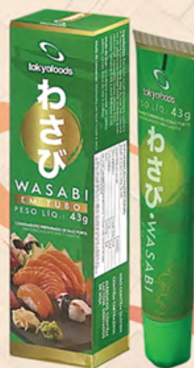
WASABI EM TUBO 43 g