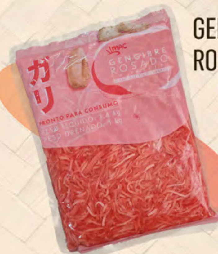
GENGIBRE ROSADO 1 kg