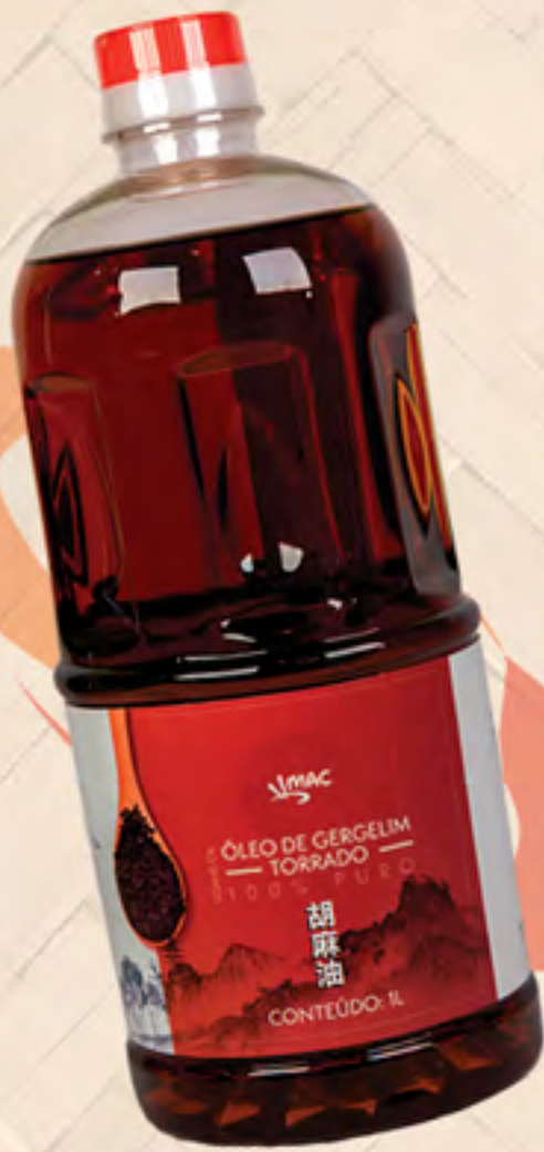
ÓLEO DE GERGELIM 100% PURO 1 Litro