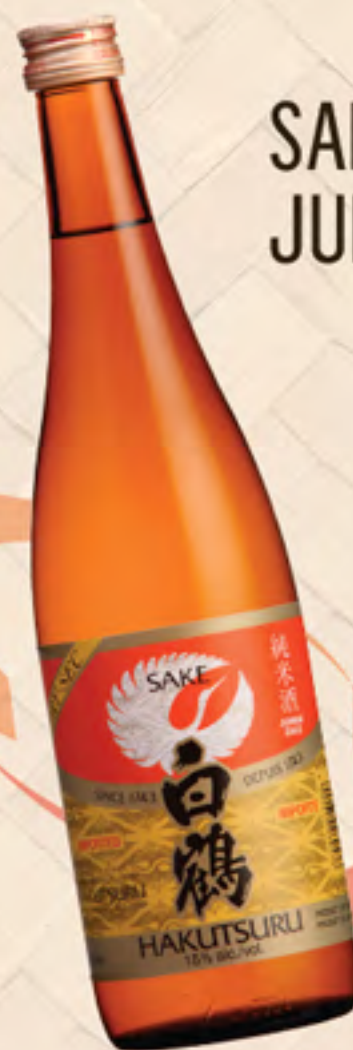
SAKE JUNMAI-SHU DRY