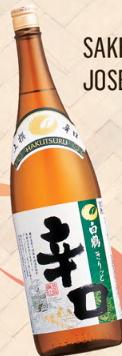
SAKE JOSEN DRY