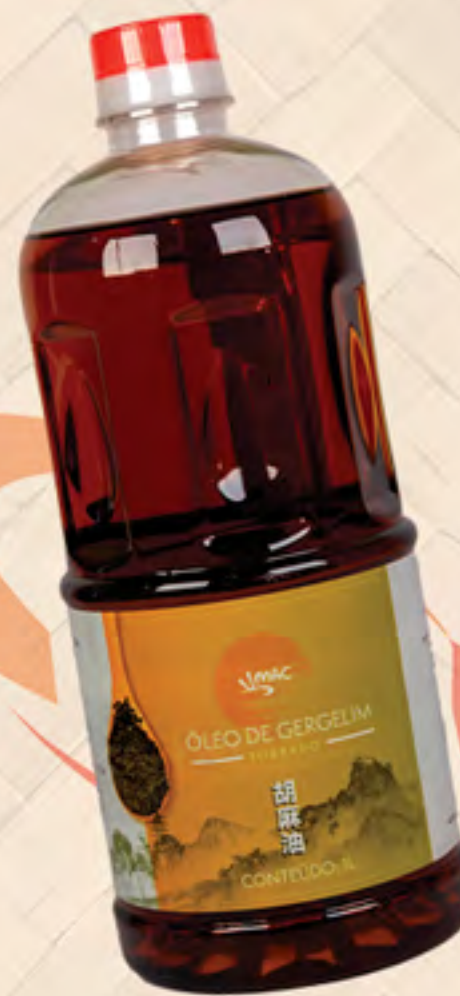
ÓLEO DE GERGELIM 1 Litro