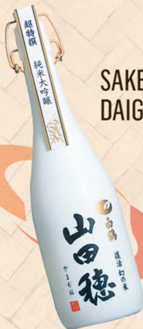
SAKE JUNMAI DAIGINJO YAMADAHO