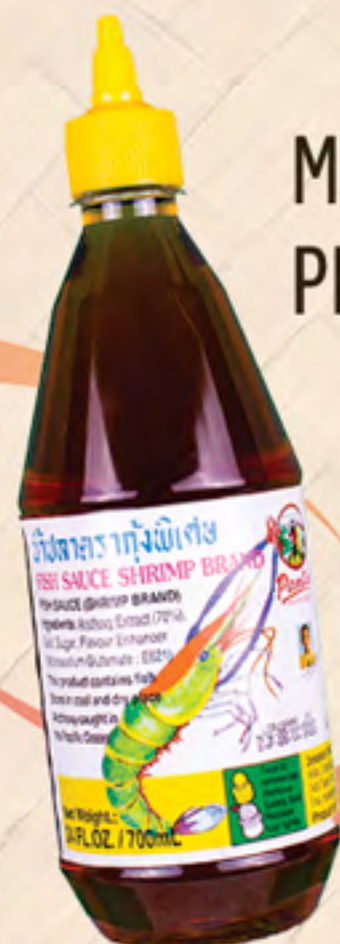
MOLHO DE PEIXE PANTAI