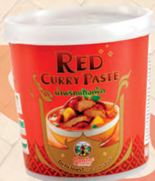
RED CURRY PASTE