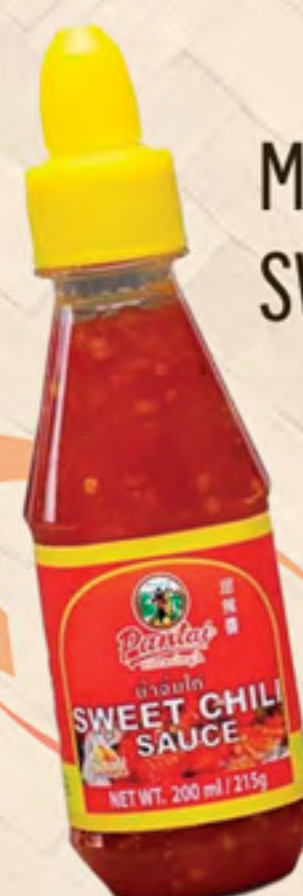
MOLHO SWEET CHILI