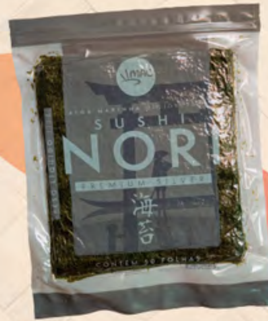
NORI SILVER 140 g