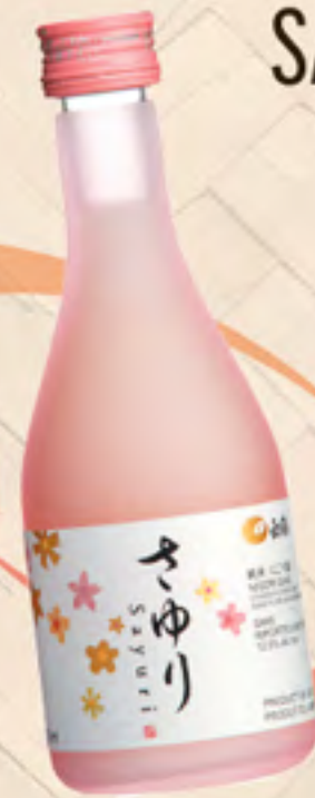
SAKE SAYURI NIGORI