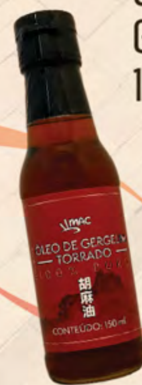
ÓLEO DE GERGELIM 100% PURO 150 ml