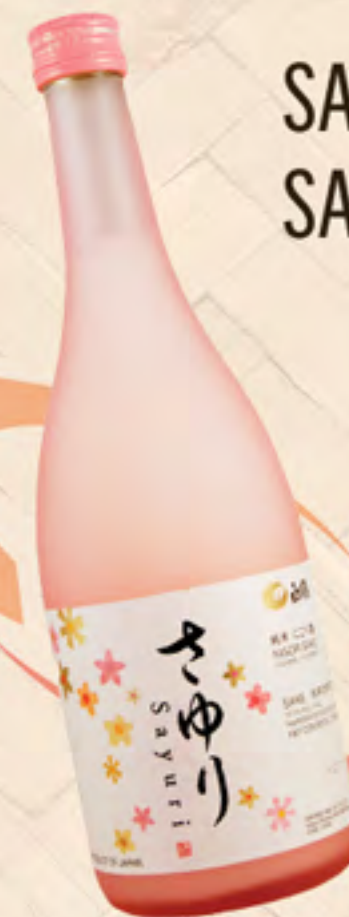
SAKE SAYURI NIGORI