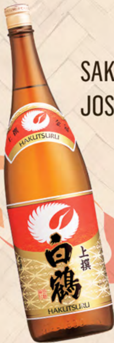
SAKE JOSEN SUAVE