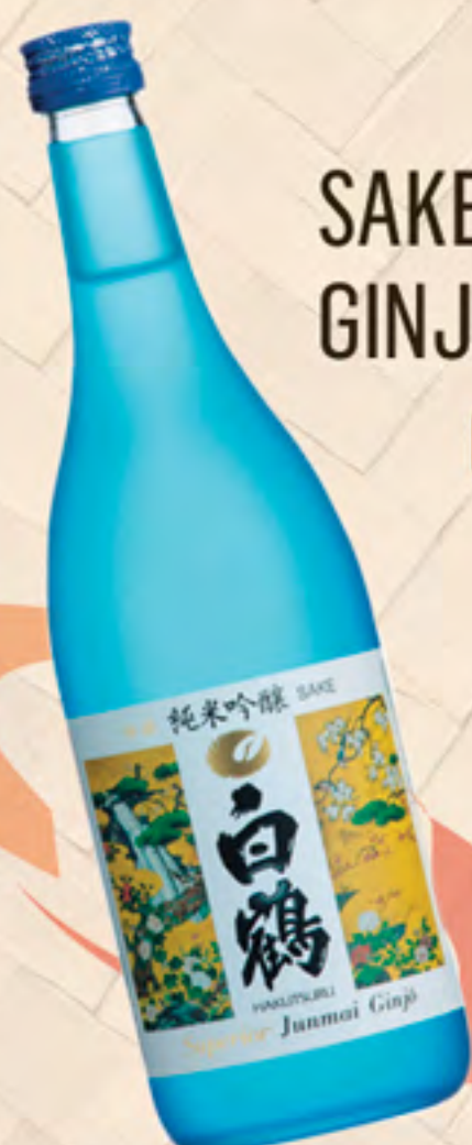
SAKE JUNMAI GINJO-SHU