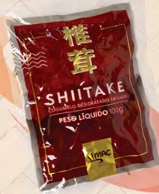
SHIITAKE FATIADO DESIDRATADO