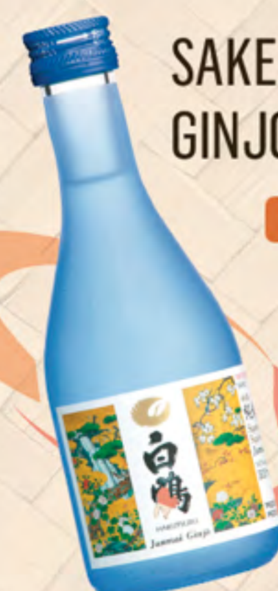
SAKE JUNMAI GINJO-SHU