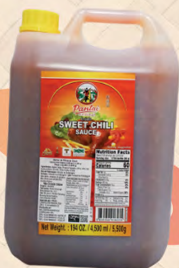
MOLHO SWEET CHILI