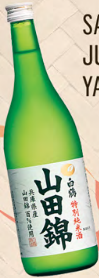
SAKE JUNMAI-SHU YAMADANISHIKI