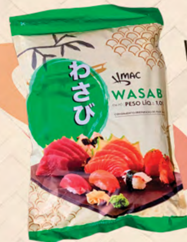
WASABI 1 kg