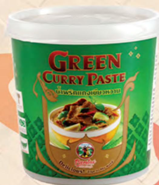
GREEN CURRY PASTE